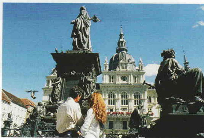
The Annual Conference will provide new insights into key sectors.

He will be providing AIPC delegates with some unique insights into how our respective destinations are positioned in the minds of both visitors and business leaders. At the same time, he has agreed to lead a discussion as to how centres can meet the challenge of achieving a destination image that appeals to business leaders, event organizers and delegates rather than just leisure visitors. This promises to be a most informative and productive session, creating valuable information for member centres to utilize in managing their place in the mix of interests driving destination marketing agendas. All the conference details are available at the Annual Conference section of the AIPC web site at www.aipc.org/