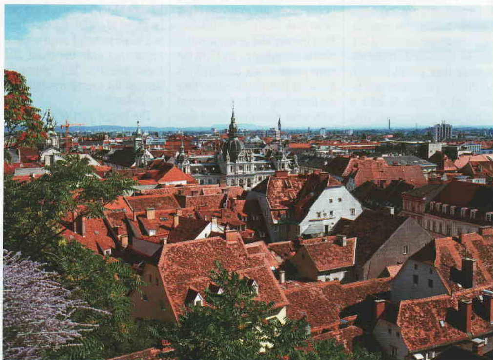
Das idyllische Graz ist Gastgeber der diesjährigen AIPC-Jahrestagung.