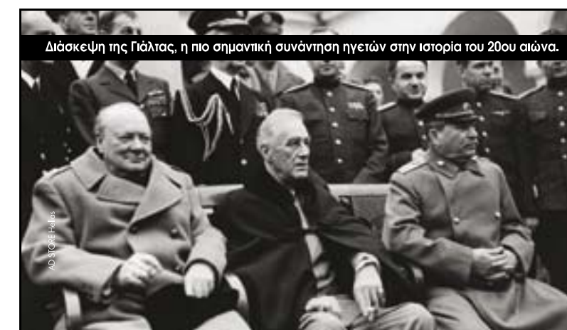
Διάσκεψη της Γιάλλας, η πιο σημαντική συνάντηση ηγετών στην ιστορία του 20ου αιώνα.

Σε μια εποχή όπου το θέμα της έλλειψης εξειδικευμένων στελεχών μας απασχολεί όλο και περισσότερο, προγράμματα όπως αυτό της Ακαδημίας της AIPC μπορούν να βοηθήσουν, εξασφαλίζοντας ότι η ποιότητα στις προσφερόμενες υπηρεσίες θα συνεχίσει να είναι ο παράγοντας-κλειδί για την επιτυχία και το μέλλον των συνεδριακών κέντρων.