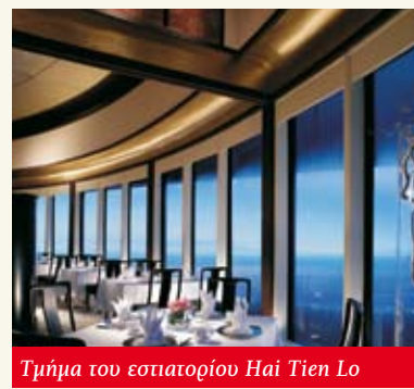
Τμήμα του εστιατορίου Hai Tien Lo

Όλες οι υποδομές του ξενοδοχείου διαρθρώνονται κυκλικά από το κεντρικό αίθριο, το υψηλότερο στη νοτιοανατολική Ασία, ενώ αξίζει να σημειωθεί ότι το ξενοδοχείο ενώνεται με τρία εμπορικά κέντρα καθώς και με το Suntec International Convention and Exhibition Center. Συνολικά, το Pan Pacific Singapore προσφέρει 778 δωμάτια , από τα οποία 63 βρίσκονται στους ορόφους 33 έως 35, κάτω από την ονομασία «Pacific Club»,