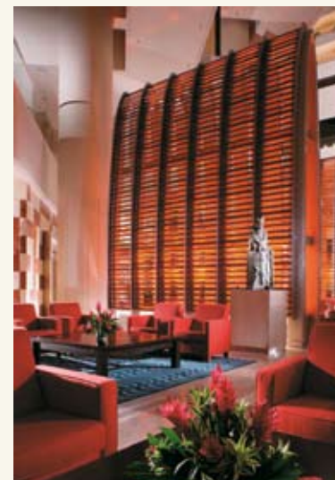
Μέρος του πανέμορφου αιθρίου

ενώ 198 στους «Executive Business» ορόφους 20 έως 27. Όλα τα δωμάτια είναι διακοσμημένα σύμφωνα με την τελευταία λέξη του design και εξοπλισμένα με τις πλέον αναπτυγμένες τεχνολογίες. Επιπλέον, οι φιλοξενούμενοι στα «Pacific Club» δωμάτια έχουν τη δυνατότητα να χρησιμοποιήσουν μία αίθουσα συναντήσεων για μία ώρα δωρεάν αλλά και να επωφεληθούν από τις υπηρεσίες car service που προσφέρει το ξενοδοχείο. Για την εξυπηρέτηση των business επισκεπτών του ξενοδοχείου, από το 2005 υπάρχει στη διάθεσή τους το πλήρως εξοπλισμένο Executive Center . Με γραμματειακές υπηρεσίες υψηλού επιπέδου σε 24ωρη βάση, ο χώρος περιλαμβάνει 3 αίθουσες εργασίας, 2 αίθουσες συναντήσεων, 4 αίθουσες συνεδριάσεων καθώς και 4 ακόμη για επαγγελματικές συναντήσεις. Οι αίθουσες «Pacific Ballroom» και «Ocean Ballroom» αποτελούν την κυρίως συνεδριακή υποδομή του ξενοδοχείου προσφέροντας χώρο μεγαλύτερο των 3.000 τ.μ. διαμορφωμένο σε δύο επίπεδα. Το «Pacific Ballroom» διαθέτει 3 αίθουσες συνολικής έκτασης 800 τ.μ. χωρίς κολώνες και 4,8 ύψος που μπορούν να υποδεχθούν έως 800 συμμετέχοντες σε θεατρική διάταξη. Οι αίθουσες του «Ocean Ballroom», 13 τον αριθμό, δέχονται ποικίλες διαρρυθμίσεις και μπορούν να υποδεχθούν από