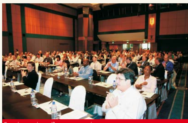
Στιγμιότυπο από την αίθουσα των εργασιών

Αυτά τα συστατικά, άλλωστε, είναι και το μυστικό της ανάπτυξης της AIPC σφ-