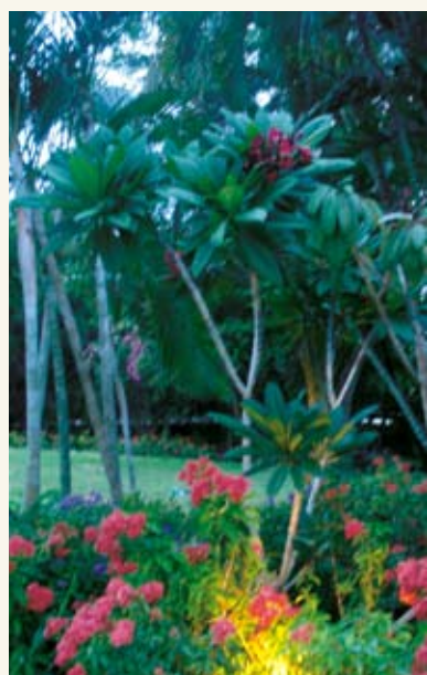
Η οργάνωση βλάστηση αποζημιώνει για τη ζέση, την υγρασία και τις ξαφνικές βροχές