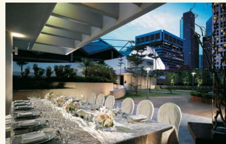
Ο χώρος της πισίνας προσφέρεται για συναντήσεις και δείπνα

30 έως 450 άτομα σε θεατρική διάταξη. Για επιχειρηματικές συναντήσεις και δείπνα διατίθεται επίσης και ο χώρος της πισίνας στον 4ο όροφο. Το Pan Pacific είναι, επίσης, και ένα γαστρονομικό παράδεισο καθώς διαθέτει επτά εστιατόρια που προσφέρουν από ευρωπαϊκή και ιταλική κουζίνα μέχρι ινδική, ιαπωνική και καντονέζικη. Αξίζει, επίσης, να σημειωθεί ότι το ξενοδοχείο ( www.panpacific.com/singapore ) παρέχει ένα υπερσύγχρονο Wellness Village, συνολικής έκτασης 1,858 τ.μ. με πλήθος υποδομών και δυνατοτήτων (πισίνα, γυμναστήριο, αίθουσες spa, γήπεδο τένις κ.ά.).