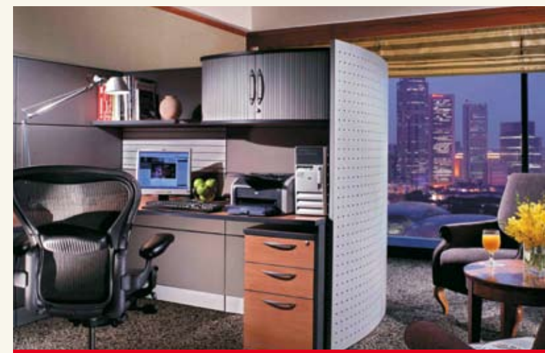
Γραφείο εργασίας στο Executive Centre