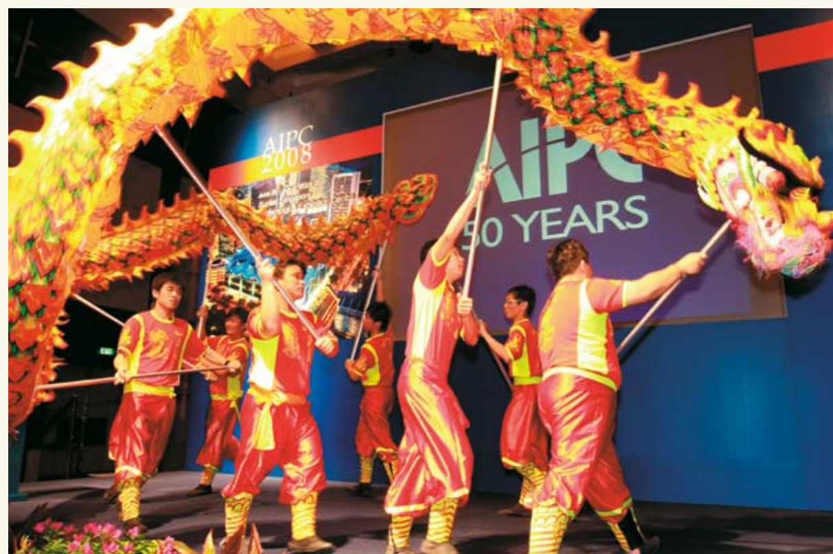
Παραδοσιακή νότα στην έναρξη του Συνεδρίου

Να παραμείνει στην κορυφή των προορισμών MICE σε παγκόσμιο επίπεδο.