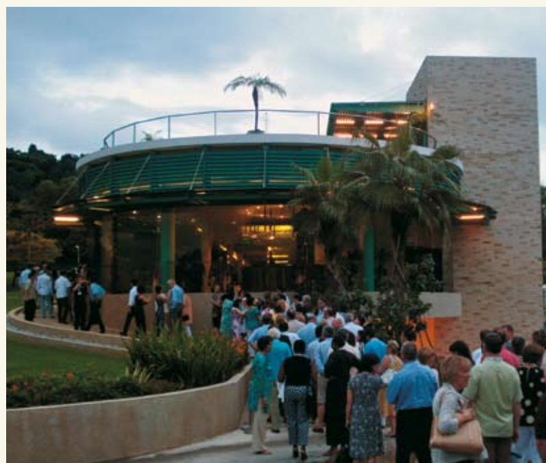
Προς το Welcome Dinner στο Sentosa Pavillion στο νησί Sentosa