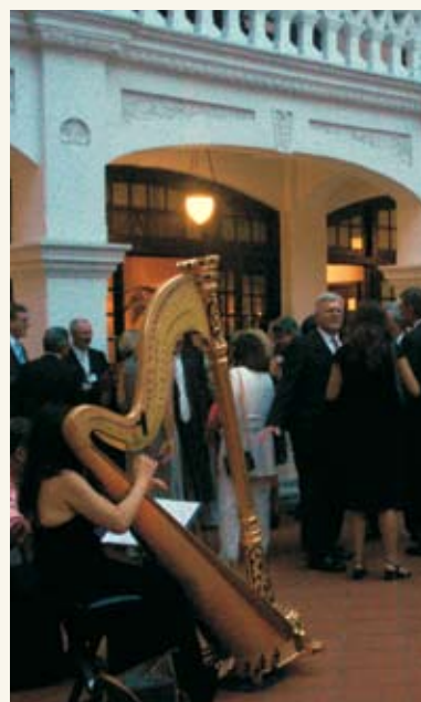
Από το επίσημο δείπνο στο ιστορικό Raffles Hotel