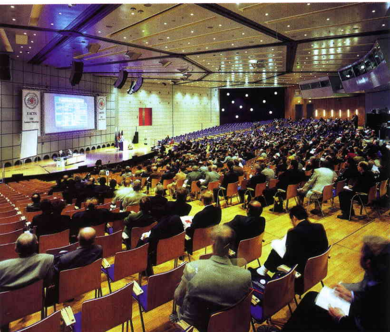
Meetings heißen berufliche Entwicklung.

Große Veranstaltungen wie beispielsweise Kongresse haben zum Ziel, die leistungsstärksten Menschen in einem bestimmten beruflichen Gebiet dort zusammen zu führen, wo Informatio-